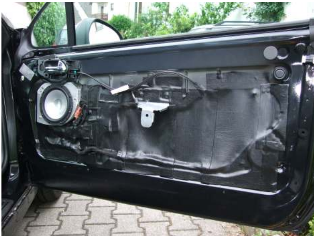
insgesamt 3,5 Dämmmatten anstatt der Schutzfolie