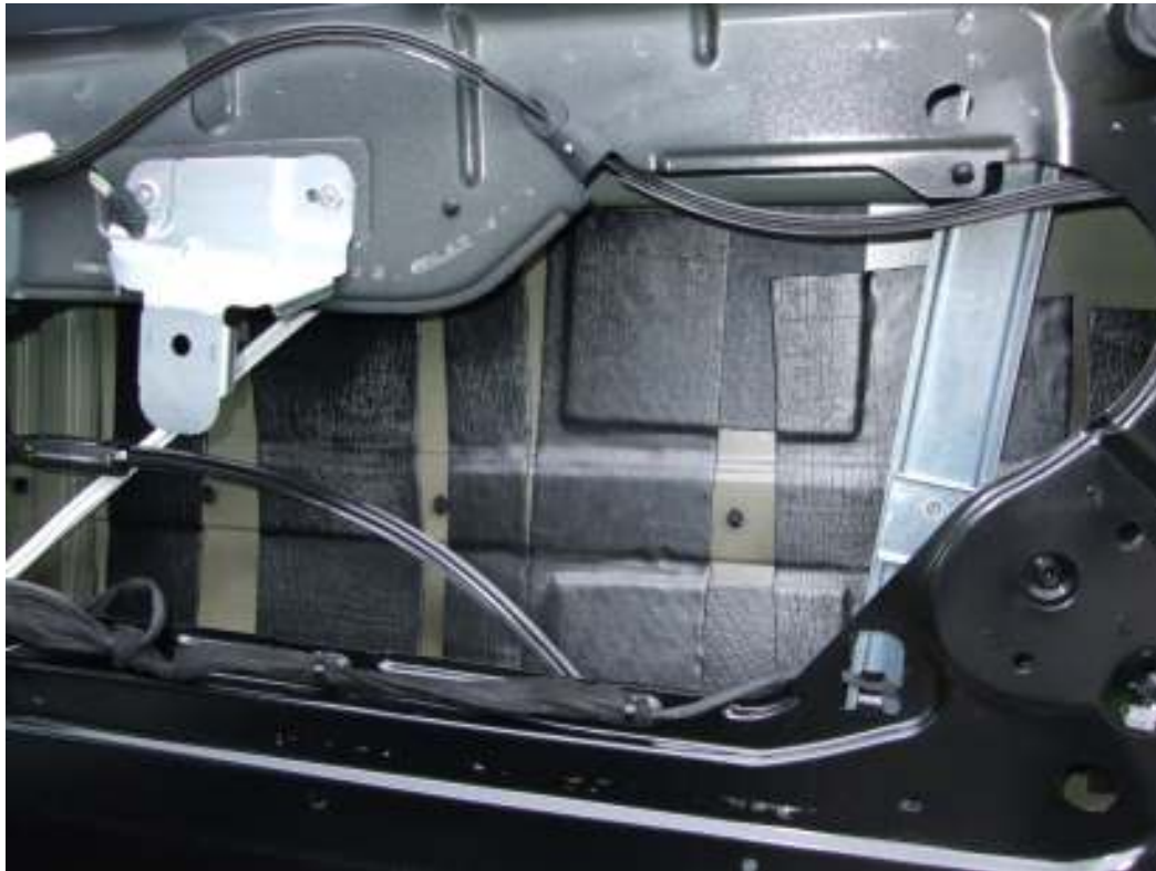
insgesamt 2 Dämmmatten auf das Außenblech