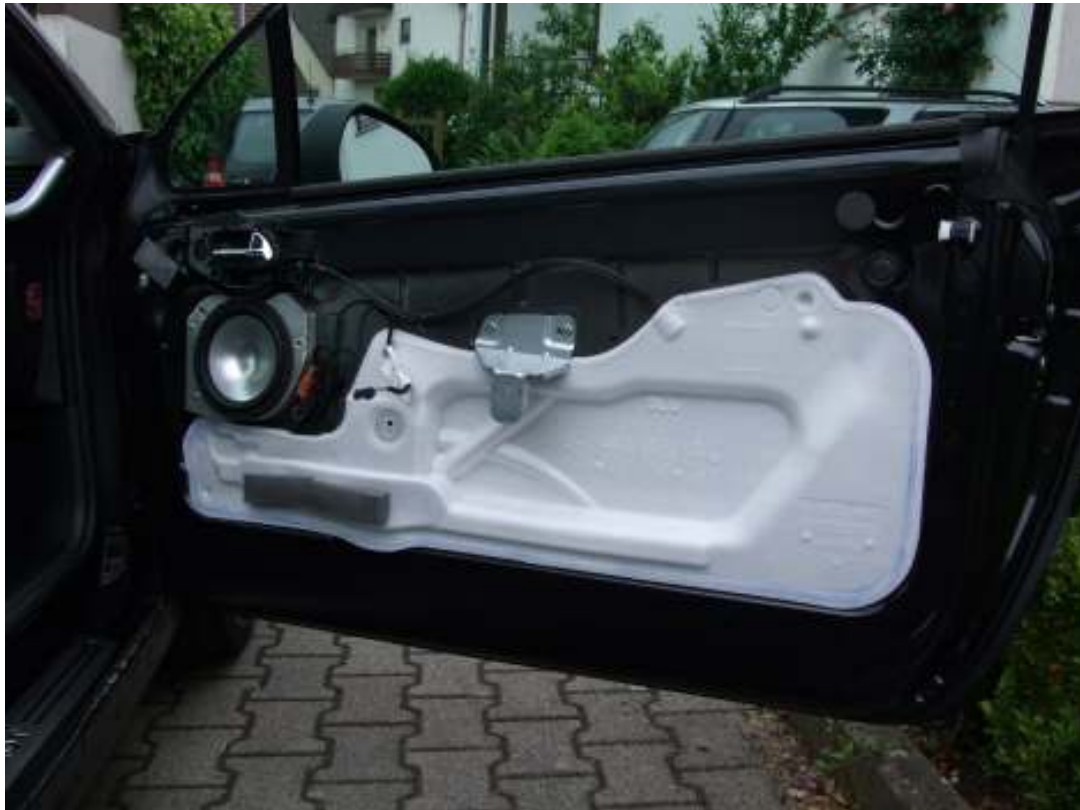
Tür mit Schutzfolie (werksseitig)