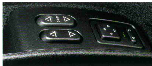
Elektrische Fensterheber vorn und elektrisch verstellbare Außenspiegel