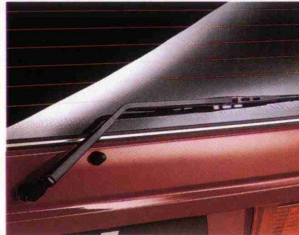
Heckscheibenwischer mit elektrischer Waschanlage