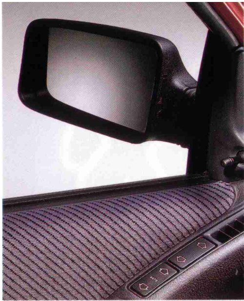
Elektrische Fensterheber vorn und von innen verstellbarer Außenspiegel