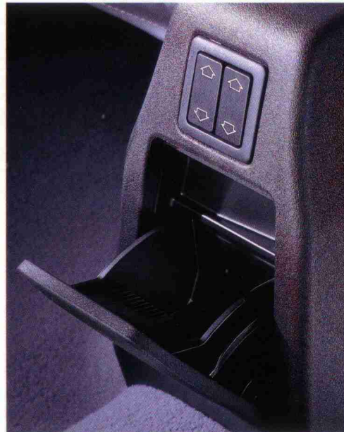
Aschenbecher hinten/elektrische Fensterheber hinten (Option)