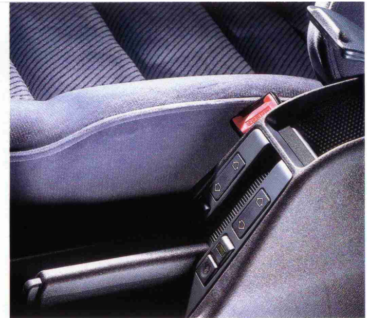
Mittelkonsole mit elektrischen Fensterhebern hinten (Option)