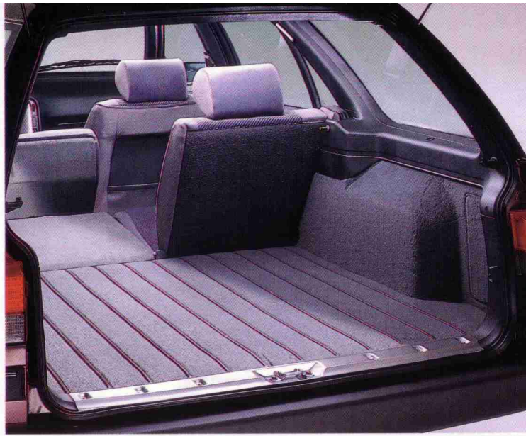
Ladefläche mit geteilt umklappbarer Rücksitzbank