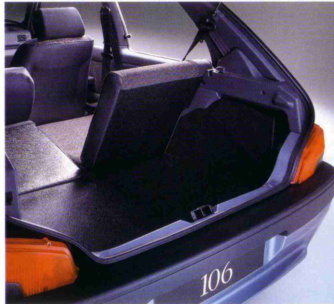
Einzel umklappbare Rücksitze und beleuchteter Kofferraum