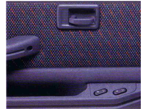
Ablagefach mit elektrischen Fensterhebern vorn