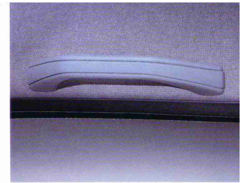
Haltegriff vorn rechts