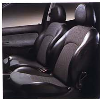
Sportsitze mit Leder-/Alcantara-/ Stoffbezug

GT – das legendäre Kürzel steht seit eh und je für Grand Tourisme, sprich: für Kraft und Dynamik von edlen Automobilen. Willkommen in der Welt des unbegrenzten Vergnügens, willkommen im PEUGEOT 206 GT. Starten Sie durch und werden Sie Teil der GT-Legende.