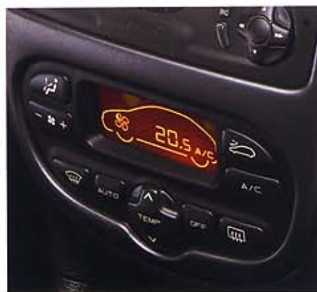
Automatisch geregelte Klimaanlage mit Digitalanzeige