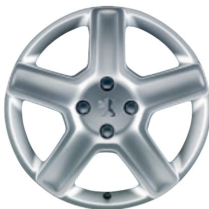
□ - Lichtmetalen velgen 'Challenger' 17"