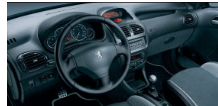
□ - Carbondesignafwerking op de middenconsole, ventilatieroosters en portiergrepen