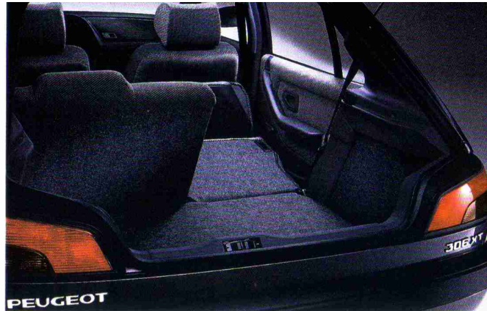
Rücksitzbank geteilt umklappbar