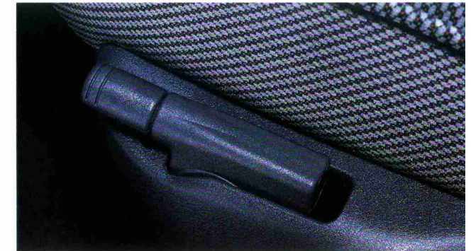
Höhenverstellung des Fahrersitzes