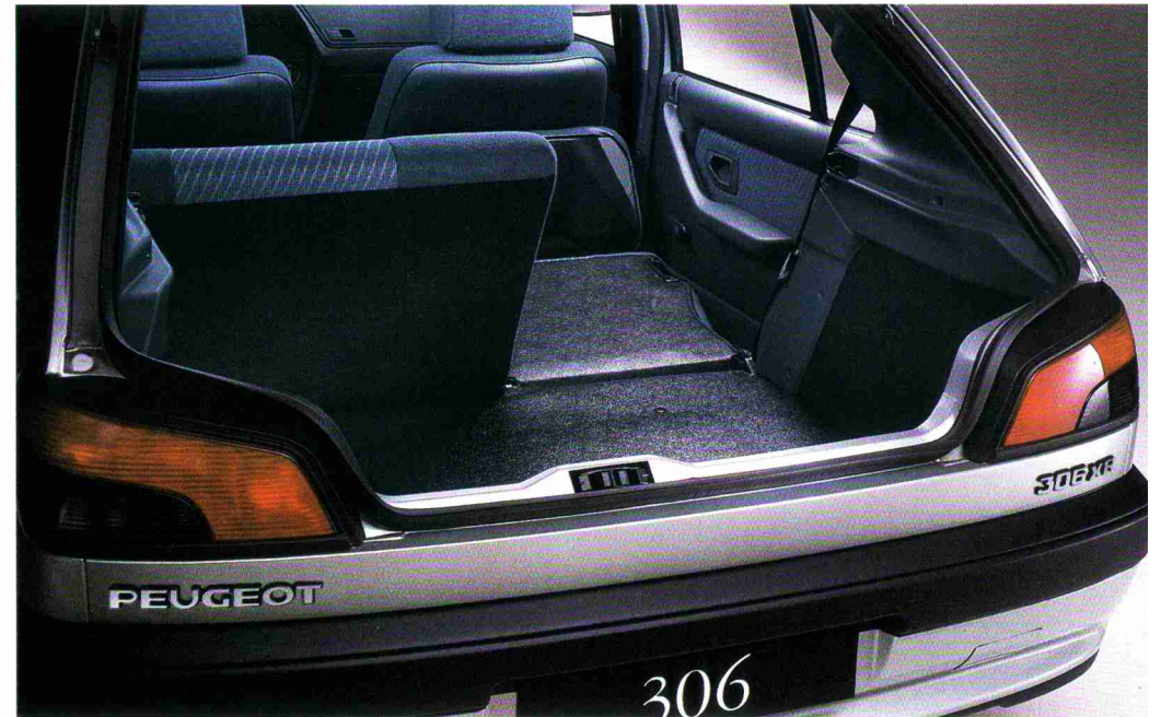
Rücksitzbank geteilt umklappbar