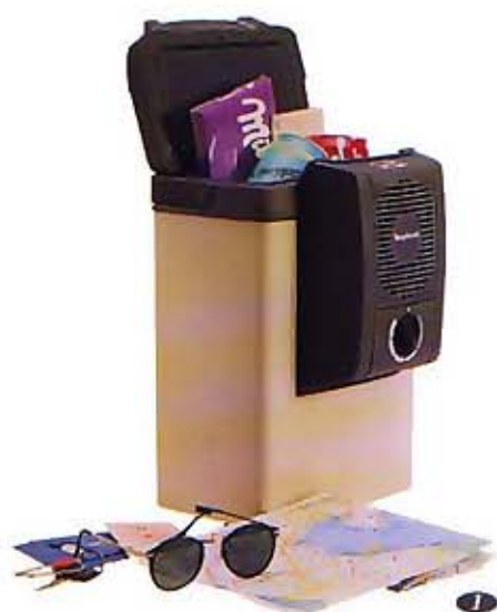
1 Kühlbox 6-Liter Inhalt, Stehhöhe für 0,7l Flaschen, Kühlleistung bis max 5°C bei 25°C Umgebungstemperatur, FCKW-frei, mit Befestigungssatz (0046.41)