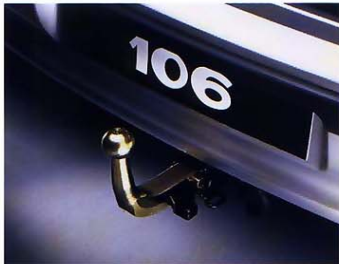
2 Anhängervorrichtung (9627.W4) Elektrosatz 13-polig (9688.91)